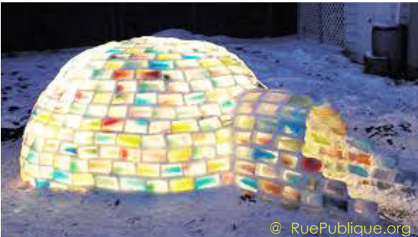
Igloo arc-en-ciel dans la Forêt des Possibles de RuePublique