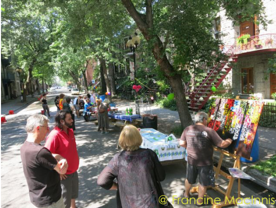
Projet : Rencontre de bons voisins