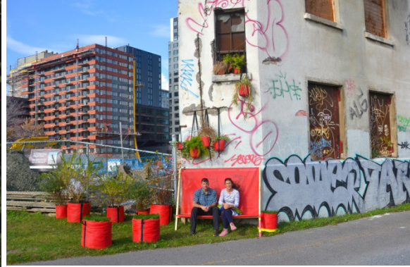
Projet : Radeau de la Méduse