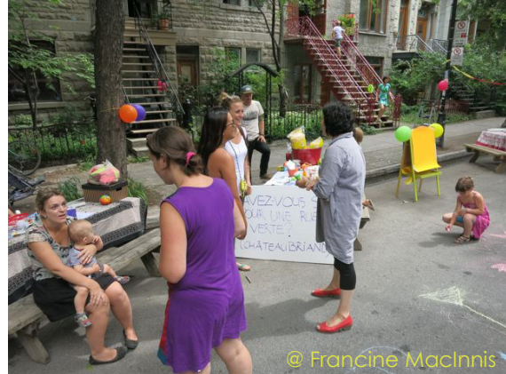
Projet : Rencontre de bons voisins