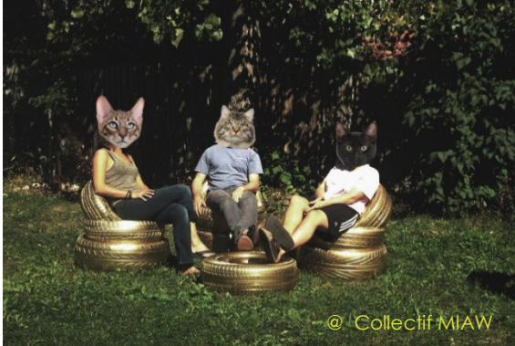
Projet : Pneus