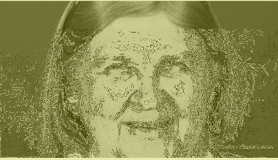
@PhotoVenus (Source : Ordre national du Québec)