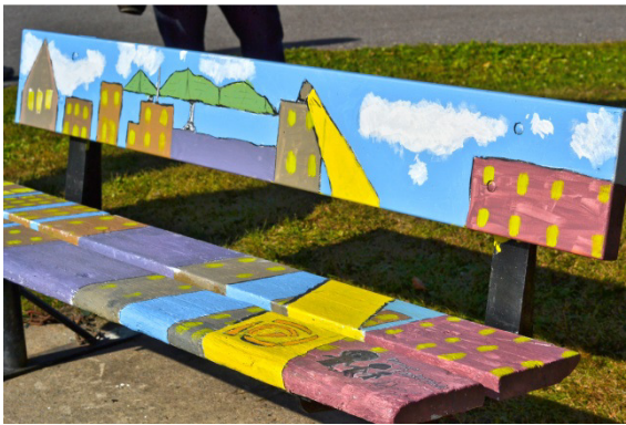
Projet : Bancs de parc à notre image

Un projet d'art public permet de mettre en valeur l' histoire , les valeurs et la culture locales . Les particularités sociales, historiques et architecturales d'un lieu se trouvent ainsi matérialisées à même l'aménagement urbain.