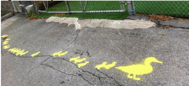
Projet : Ruelle Mile-E

L'ajout de peinture, de pancartes et de mesures pour ralentir la circulation et sensibiliser les usagers de la route aux besoins des plus vulnérables représentent des options valables dans le cadre de ce projet. Ces réalisations doivent néanmoins être autorisées par les autorités de votre arrondissement ou de la Ville de Saguenay. La plantation d'arbres et des aménagements imposants peuvent également jouer un rôle dans le ralentissement des automobilistes.